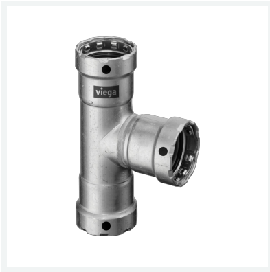
Megapress-T-Stück mit SC-Contur Modell 4218 Artikel 695 026