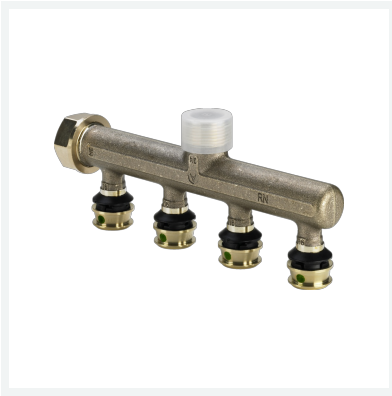
Raxofix-Verteiler mit SC-Contur Modell 5326.05 Artikel 645 595