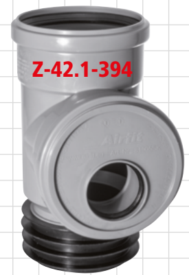
DN 110/50 Art. Nr. 199050SA

Brandverhalten: Geprüft nach DIN 4102-B2, EN 13501-1E, EN 11925-2.