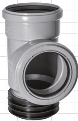
DN 110/90 Art. Nr. 199090SA