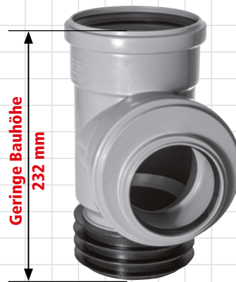
DN 110/75 Art. Nr. 199075SA