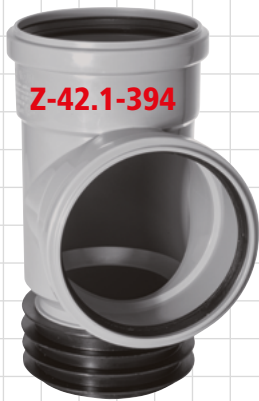
DN 110/110 Art. Nr. 199110SA